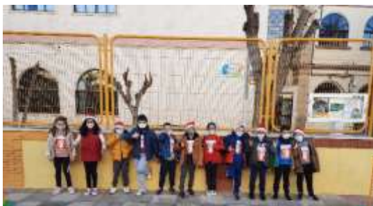
1º Y 2º PRIMARIA